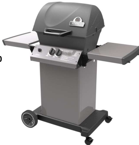
COMPACT PRO 220 08185